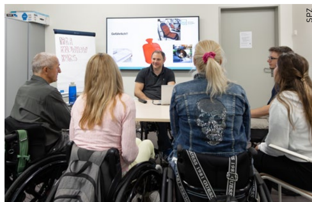
Die Peers beteiligen sich unter anderem an der Patient:innenedukation in Gruppenschulungen.

«Peer Counselling» bezeichnet eine spezielle Form der Beratung, bei der Betroffene durch Betroffene beraten werden. Dabei wird davon ausgegangen, dass Menschen, die sich in einer bestimmten Situation befinden, am glaubwürdigsten Hilfe von Menschen annehmen können, die ähnliche oder vergleichbare Situationen durchlebt haben. Diese alltags- und lebensweltorientierte Beratung gibt Menschen in der Rehabilitation Hoffnung, Mut und Zuversicht für das jetzige und künftige Leben.